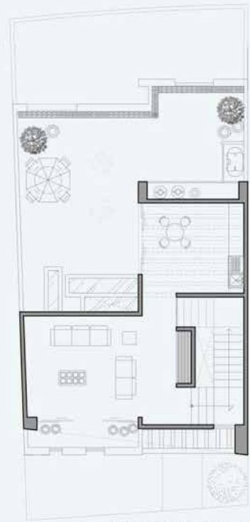
PLANTA ROOF GARDEN