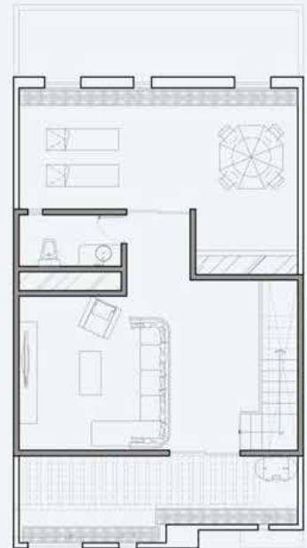
PLANTA ROOF GARDEN